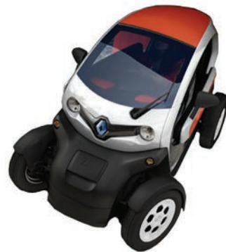
3 Quadricycle léger